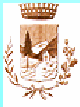
Comune di Ampezzo